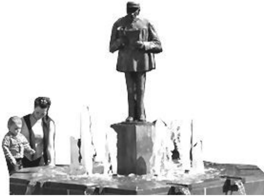
Le « Crieur de Marche-en-Famenne »

Nous ajoutons cette année un septième chapitre au Grand Feuilleton Historique, que les plus fidèles de nos ESTIVADIERS ont pu suivre, au fil des numéros de leur ESTIVADES-INFOS édition 2003. Pour les autres, en voici un petit résumé.